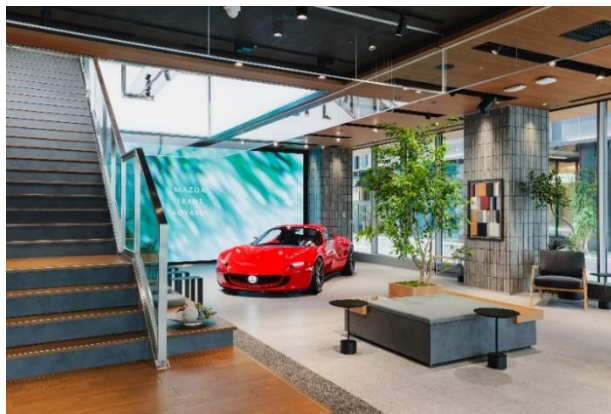
MAZDA TRANS AOYAMA, planta baja